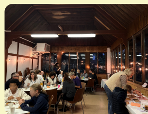
Repas sur le format d'une auberge espagnole