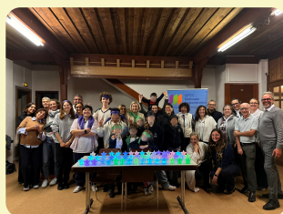
Les vainqueurs de la grande chasse aux étoiles