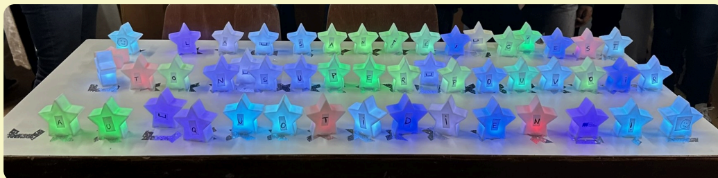
La constellation à reconstituer, indiquant "La santé est ton super pouvoir au quotidien !"

Répartis en équipes, les participants se sont lancés dans une grande chasse aux étoiles autour du thème de la "Constellation de la Santé". Énigmes, défis physiques et épreuves de manipulation ont rythmé la soirée jusqu'à la reconstitution finale d'une constellation lumineuse.