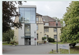
RDV au Pavillon 17/2