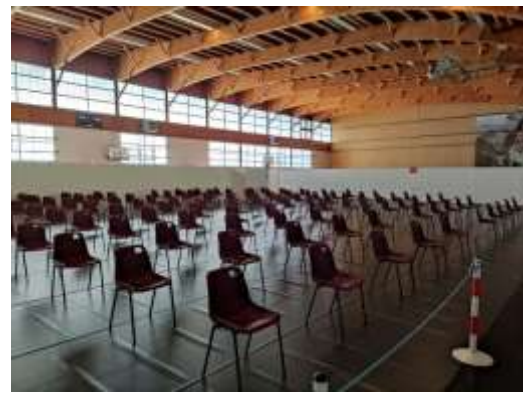
31/05/21 au 01/10/2021 : Centre de vaccination au Gymnase universitaire configuration 12 box