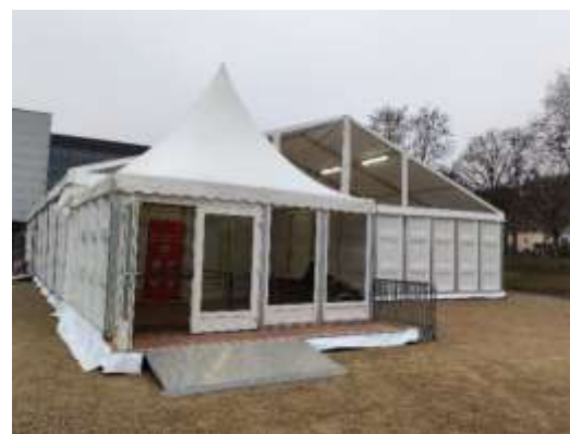
Depuis le 20/12/2021 : Centre de vaccination de Mulhouse dans une structure éphémère semi rigide sur le parvis du Palais des sports Gilbert Buttazzoni