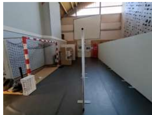
02/10/21 au 19/12/2021 : Centre de vaccination au Gymnase universitaire configuration 3 box