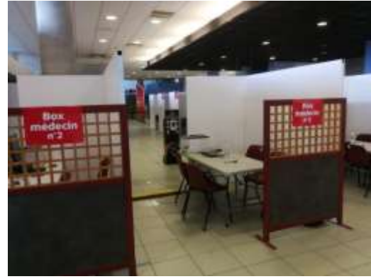
18/01/21 au 31/05/21 : Centre de vaccination de Mulhouse au Palais des sports Gilbert Buttazzoni