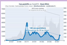
Cas positifs Données: covidtracker.fr